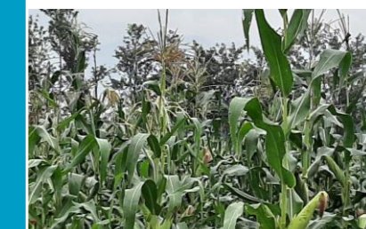
Champ de production de semence maïs UVDS à KINYANDONYI