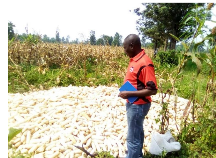
Récolte de Maïs en Territoire de Rutshuru