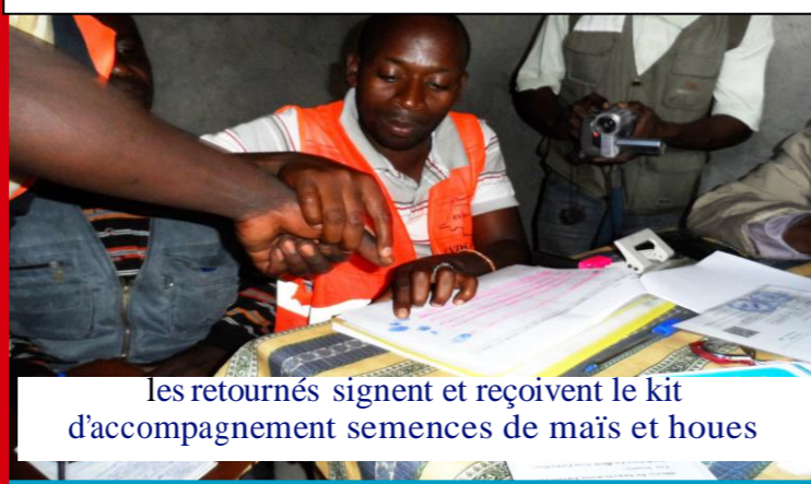
Les retournés signent et reçoivent le kit d'accompagnement semences de maïs et houes