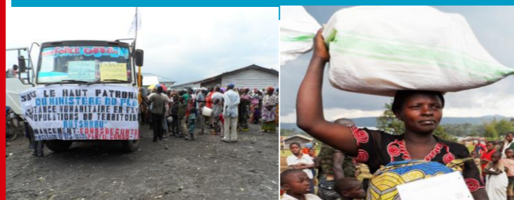
Les déplacés retournent chez eux en territoire de Rutshuru et Nyiragongo

Projet de sensibilisation au retour volontaire des déplacés dans des camps aux alentours de la ville de Goma. 4000 ménages soit 20000 personnes retournent dans leurs milieux respectifs par UVDS-Ambassade du Japon.