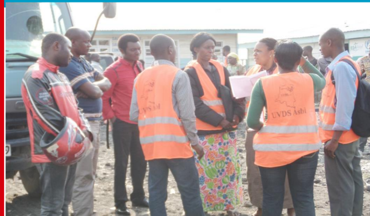
L'équipe de UVDS en pleine sensibilisation des déplacés au retour volontaire dans le camp de MUGUNGA

Sous le haut patronage du Ministère National du Plan Assistance Humanitaire en faveur des populations des Territoires de Rutshuru, Nyiragongo, Masisi. Financement de Fonds et contrepartie entre l'Ambassade du Japon et le Gouvernement Congolais.