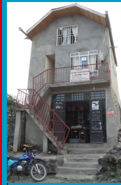
Bureau Administratif UVDS de Goma coordinationuvds@gmail.com

L'Unité des volontaires pour le développement social, UVDS en sigle, est une association sans but lucratif Créée e le 15 aout 2000 en province du Nord Kivu, territoire de Rutshuru, collectivité de Bwito .Agrée par l'arrêté du gouverneur du Nord kivu portant fonctionnement, UVDS détient son certificat d'enregistrement du ministère national du plan. Son bureau de la coordination :